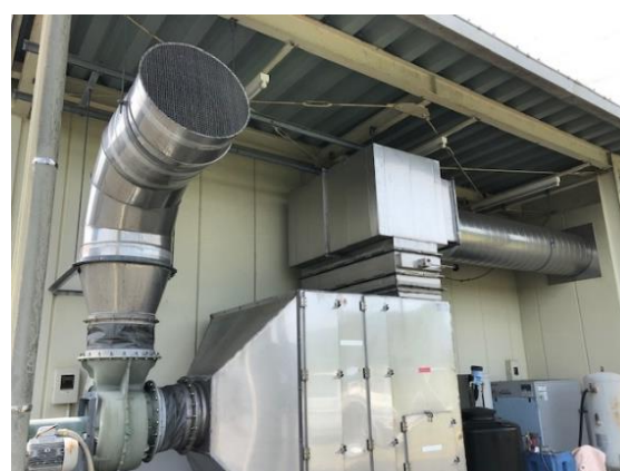
【静岡工場】 脱臭装置