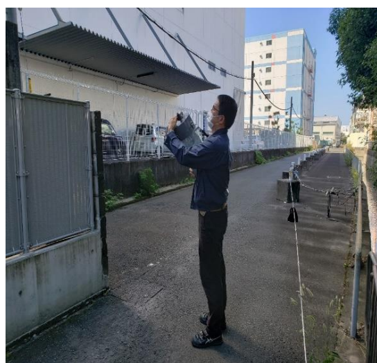
【大阪工場】2021年10月4日 測定状況