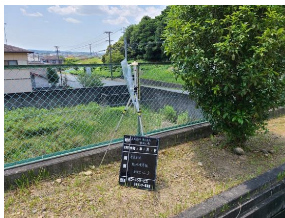
【静岡工場】2021年6月1日 測定状況