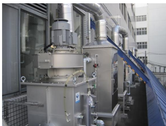
【大阪工場】 脱臭装置