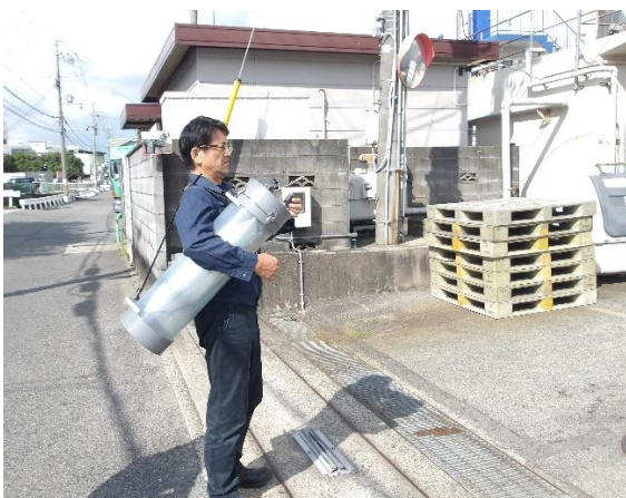
【大阪工場】2025年10月1日 測定状況