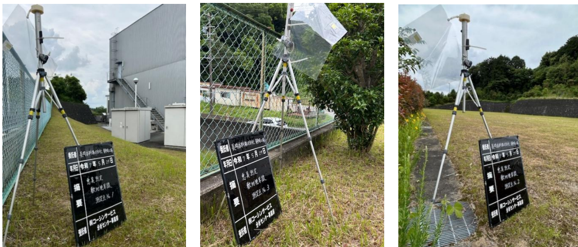
【静岡工場】2025年5月29日 測定状況